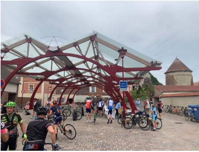
Ravitaillement à la halle de Bresles