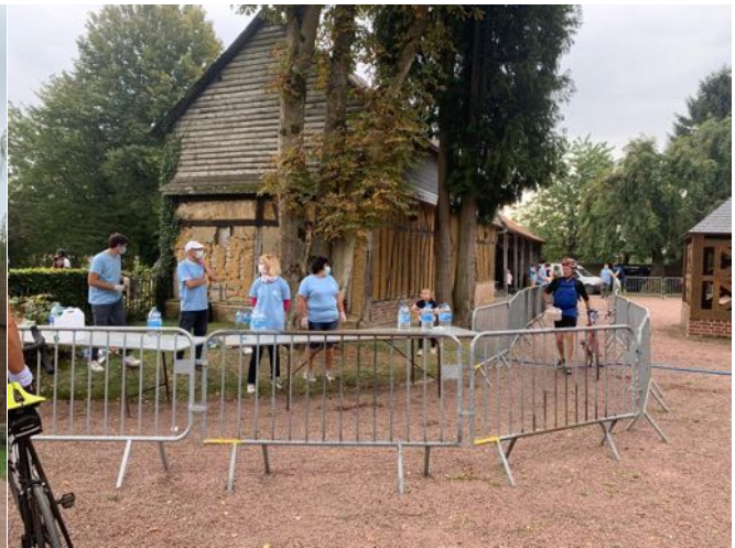
Commanderie des Templiers de Sommereux