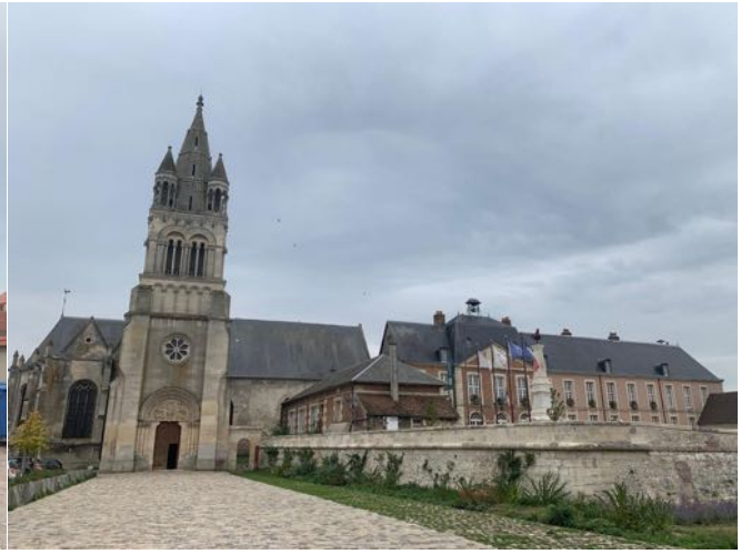
Eglise et hôtel de ville de Bresles

Les cyclos rapides avaient dû prendre le départ à Chantilly, ils étaient en pleine forme mais ont abusé sur leur première étape et finalement ils resteront derrière je ne les reverrai qu'à Sommereux où ils arrivent quelques minutes après moi. Le ravitaillement à Sommereux est organisé à la commanderie des Templiers, avec un pré où nous pouvons manger autour de véhicules anciens. À côté mon vélo vintage paraît presque neuf.