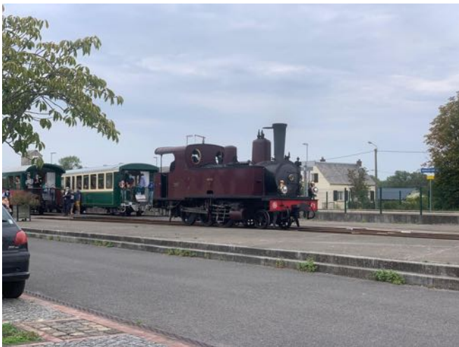
Le train de la Baie de Somme

À Noyelles sur mer le train de la Baie de Somme se prépare à emmener les touristes mais la locomotive à vapeur manœuvre avant le départ.