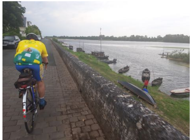
Le paysage est sympa avec la Loire et sa flotte d'embarcation en bois