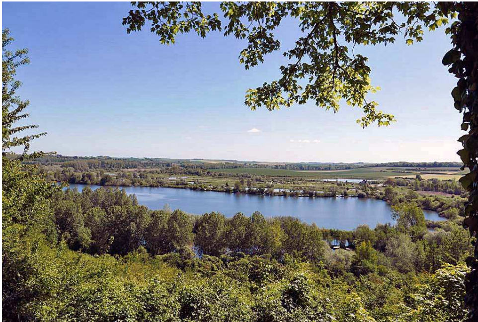
Le camp de César

À Chipilly nous pouvons voir un monument représentant un soldat consolant son cheval blessé. Pendant la grande guerre l'armée utilisait encore beaucoup de chevaux qui ont aussi été victimes des combats. Ce monument est érigé en l'honneur de la 58ème division britannique, la "London Division". La sortie du village se fait par une route pentue qui nous conduit à un belvédère au-dessus de la vallée de la Somme. Le lieu est dénommé le camp de César. Un oppidum aurait été installé à proximité pour surveiller la vallée.