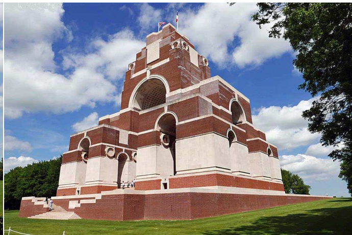
Thiepval, mémorial britannique aux disparus de la Somme

Après Thiepval on arrive à la tour Ulster, réplique du château tour où la 36ème division d'Ulster s'entraînait, près de Belfast.