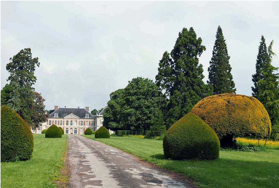
Château de Courcelles sous Moyencourt

Au retour nous visiterons la cathédrale d'Amiens, la plus grande de France, épargnée par les combats et remarquable par l'accomplissement artistique à l'apogée du gothique. Inscrite au patrimoine mondial de l'Unesco depuis 1981 et depuis 1998 comme étape sur le chemin de Saint-Jacques-de-Compostelle.