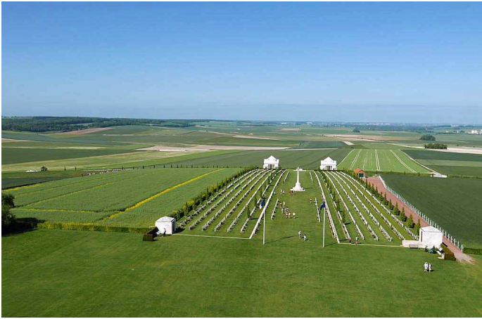
Cimetière de Villiers-Bretonneux vu du sommet de la tour