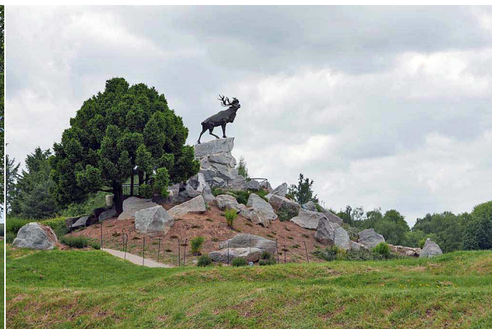
Le mémorial des Terre-Neuviens

En plus de ces mémoriaux nous verrons de nombreux cimetières du Commonwealth ou des cimetières des villages où l'on trouve des tombes de soldats.