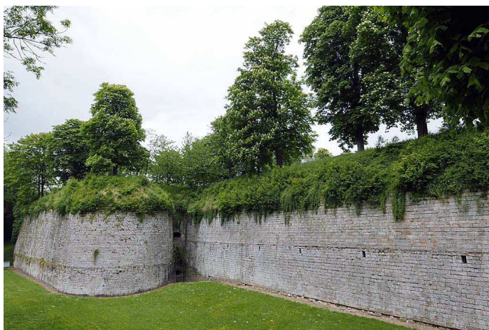
Citadelle de Doullens

Nous aurons fait 100 km en allongeant le petit parcours pour aller à Luceux, cité médiévale surplombée par son château et gardée par une porte fortifiée par laquelle Jehanne d'Arc passa en novembre 1430, venant d'Arras, allant au Crotoy. On peut aussi y voir de nombreuses maisons anciennes autour de la place centrale du village.