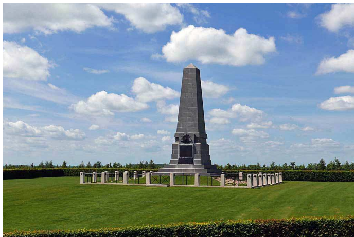
Pozières mémorial de la 1ère division australienne

Encore quelques kilomètres et nous voici à Pozières, autre site BPF de la Somme. Ici se situait le blockhaus allemand "Le Gibraltar". À côté de ses ruines on trouve maintenant un mémorial dédié à la 1ère division australienne. Un peu plus loin c'est un cimetière anglais et au loin on aperçoit le mémorial anglais de Thiepval dédié aux soldats britanniques ou sud-africains qui n'ont pas de sépulture connue, faute de les avoir retrouvés ou identifiés. Près de 78 000 noms de ces soldats sont gravés sur le monument.