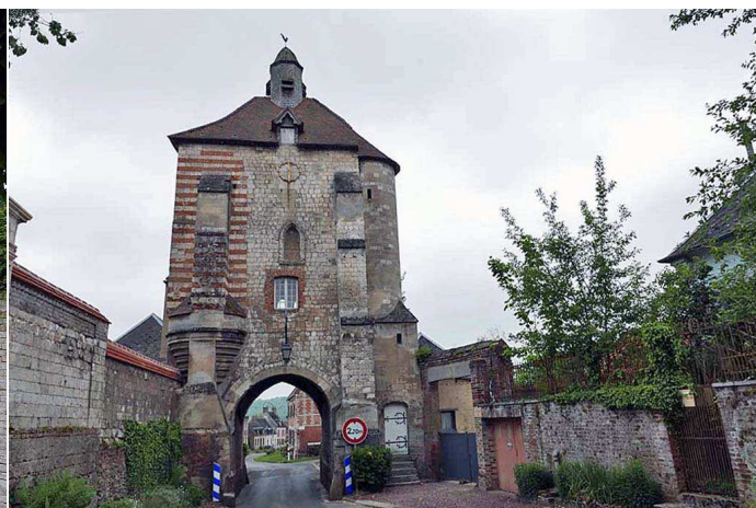
Porte fortifiée de Luceux

La cérémonie se tiendra au gymnase de la permanence dans lequel on peut voir une exposition sur les "Chasseurs cyclistes de la grande guerre". On y verra notamment deux vélos "Gérard", vélos pliants conçus pour être portés sur le dos des chasseurs.