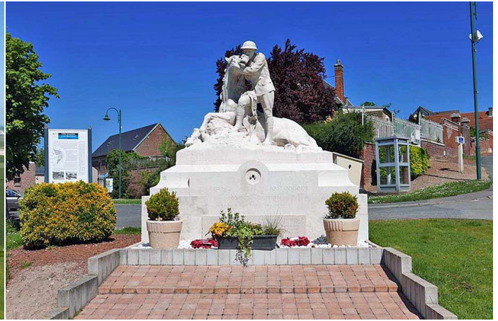
Monument de Chipilly

À Chipilly nous pouvons voir un monument représentant un soldat consolant son cheval blessé. Pendant la grande guerre l'armée utilisait encore beaucoup de chevaux qui ont aussi été victimes des combats. Ce monument est érigé en l'honneur de la 58ème division britannique, la "London Division". La sortie du village se fait par une route pentue qui nous conduit à un belvédère au-dessus de la vallée de la Somme. Le lieu est dénommé le camp de César. Un oppidum aurait été installé à proximité pour surveiller la vallée.