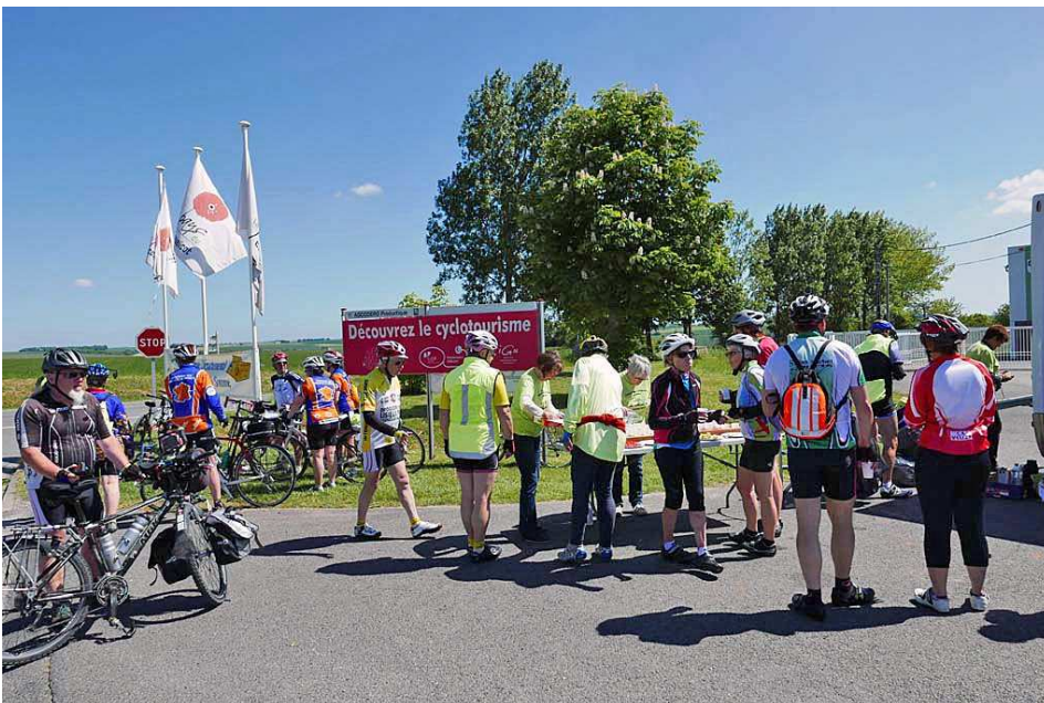
Accueil à Bray-sur-Somme

Un accueil est organisé à Bray-sur-Somme où nous pointerons pour le BPF de la Somme, avant le pique-nique au marché d'Albert.