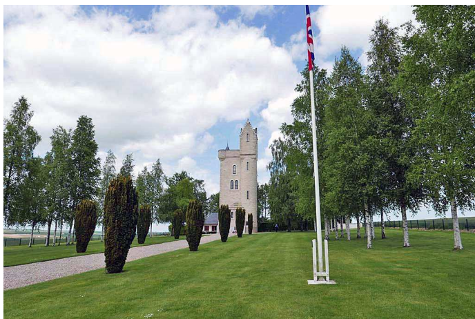
La tour Ulster

Dernier mémorial du parcours, à Beaumont-Hamel, celui des Terre-Neuviens, soldats canadiens originaires des îles de l'Atlantique. Le site préserve les vestiges des tranchées. Un caribou au sommet d'un monticule en pierre veille sur le site. Le 1 er juillet 1916 le 1 er régiment royal de Terre-Neuve a été presque entièrement décimé : 710 victimes sur 768 combattants volontaires.