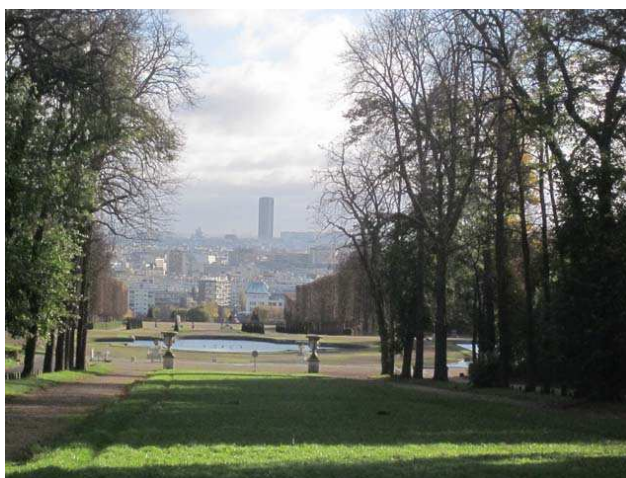
Au Tapis vert nous apercevons Paris et la tour Montparnasse

Premiers arrêts dans le parc de Saint-Cloud :