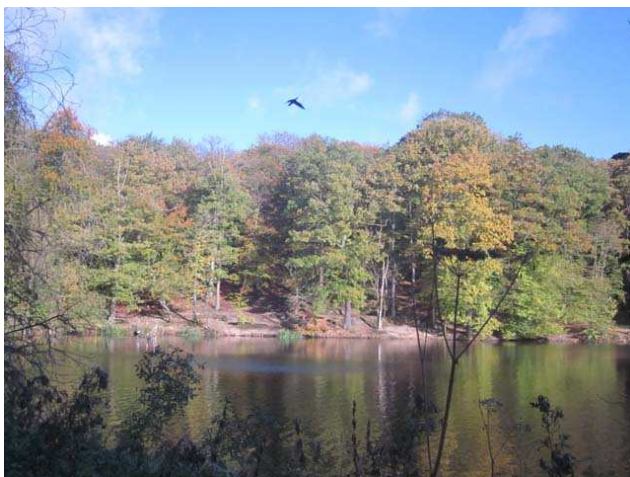
Voici ensuite l'étang de Villebon avec des couleurs d'automne