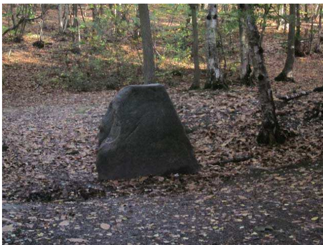
Un peu plus loin on passe devant le Menhir de la Pierre aux Moines dans le bois de Clamart