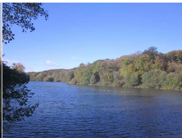
Nous suivrons ensuite assez longtemps la vallée de la Bièvre qui alimente notamment l'étang de la Geneste