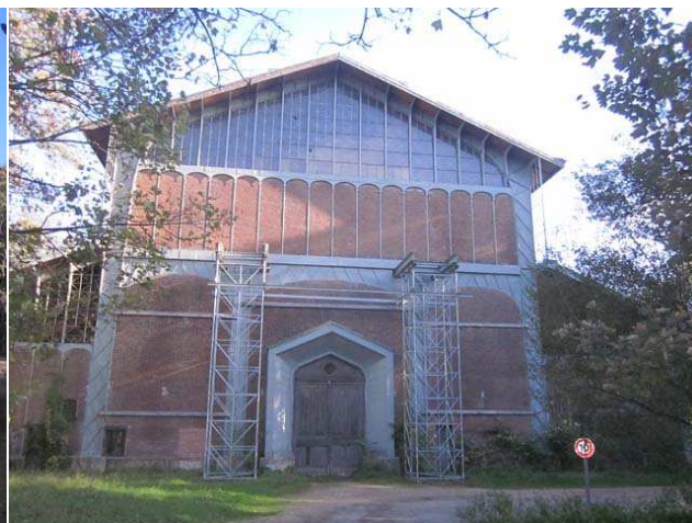
Puis le Hangar Y, vestige du premier hangar à dirigeables au monde