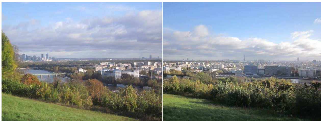
Au Rond de la Balustrade la vue est très large et ce matin le ciel est très lumineux.