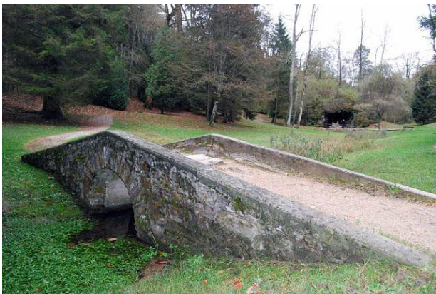
Premier pont sur la Seine