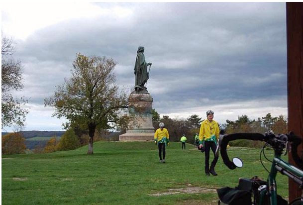
Alise Sainte Reine