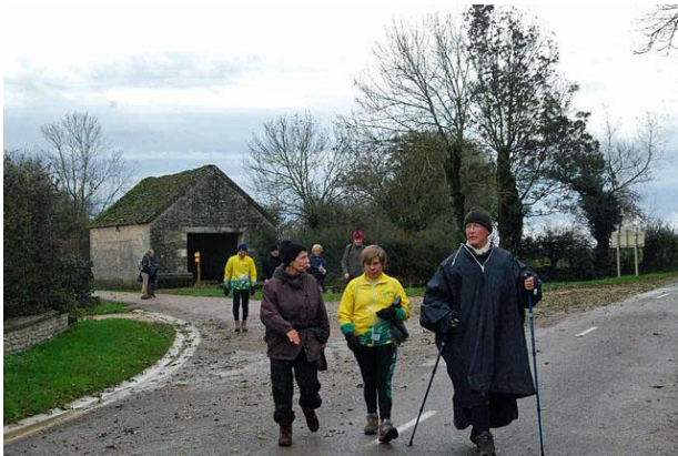
Au lavoir de Froideville

Premier lavoir à Cestre. Un panneau nous apprend qu'en 1827 le conseil municipal de Saint-Martin du Mont a décidé de doter le village et ses hameaux de lavoirs et de fontaines. La réception définitive de celui de Cestre a eu lieu le 1er décembre 1834.