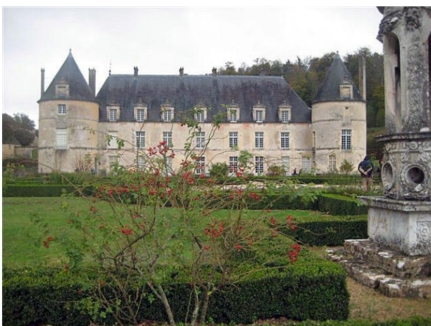
Château de Bussy-Rabutin

La panse bien pleine, les cyclos prennent le chemin du retour et nous visitons avec une guide le château de Bussy-Rabutin.