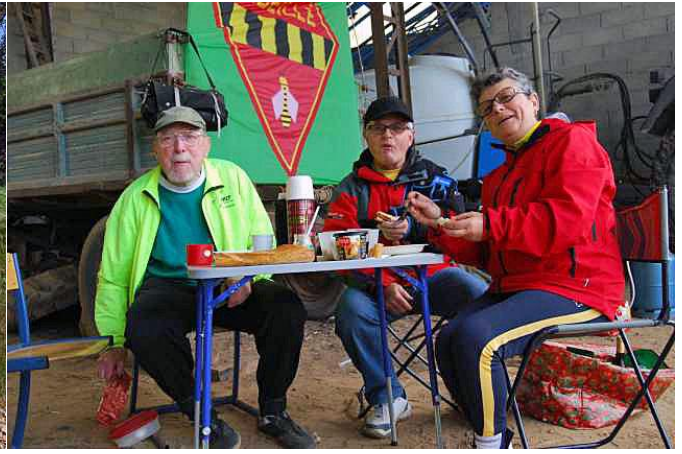
Vers 14h30 les derniers cyclos repartent et les contrôleurs peuvent remballer.