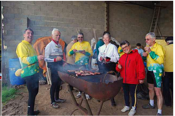
Finalement la pluie cesse avec l'arrivée des groupes venus pour le barbecue et le soleil apparait vers la fin de cuisson des grillades et saucisses. Nous avons donc le choix de manger sur l'herbe ou sous le hangar.