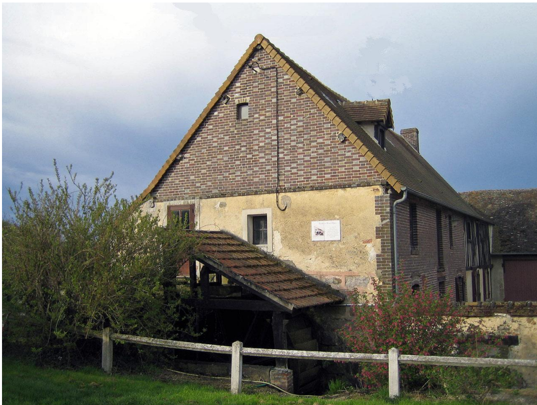
Moulin du Mesnil Opton

Thomas a profité de sa première participation à l'accueil au moulin pour faire une vidéo qui peut être vue en allant sur le site Abeille-cyclotourisme.fr .