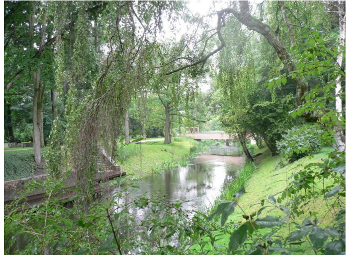
Pluie dans le jardin de la maison natale de Chopin