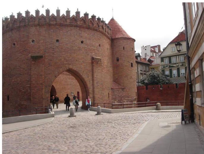
Entrée reconstruite de la vieille ville de Varsovie

Le retour se passera en train, avec deux étapes fortes: Berlin (Hauptbahnhof) avec le retour de la magnifique cuisine allemande, puis l'incontournable Karlsruhe (la Gallardon des allemands) avec son ptidej allemand et son château.