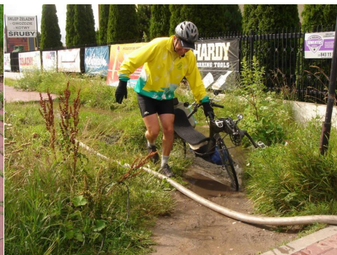
Bienvenue à Varsovie