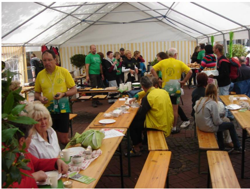
Osterode: le stand écologiste qui vend des gâteaux

Le petit déjeuner de 7h30 est correct, comme d'habitude. Nous partons sur le plat, puis nous montons par une jolie piste cyclable jusqu'à Holzerode. Nous poursuivons par une jolie route en balcon qui rebondit. De nombreux motards nous croisent ou nous doublent. Nous nous arrêtons à Osterode pour