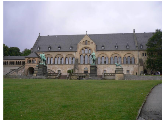
Goslar: le château

Le petit déjeuner de 7h30 est correct, comme d'habitude. Nous partons sur le plat, puis nous montons par une jolie piste cyclable jusqu'à Holzerode. Nous poursuivons par une jolie route en balcon qui rebondit. De nombreux motards nous croisent ou nous doublent. Nous nous arrêtons à Osterode pour