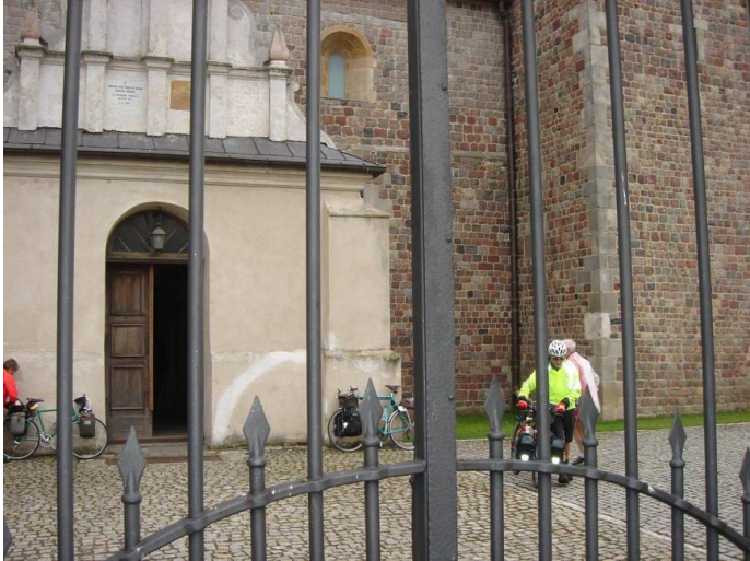
Église de Tum

s'accumule: on a l'impression de rouler dans une flaque d'eau continue. A la gauche de l'ornière, on a l'impression d'être au milieu de la route, tant les camions qui foncent passent au ras du bord droit, surtout dans les croisements.