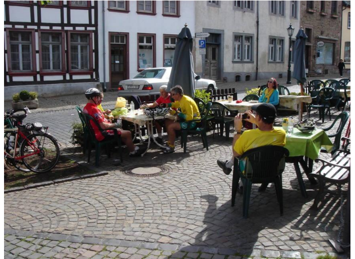
Bistro à Bad Munstereifel