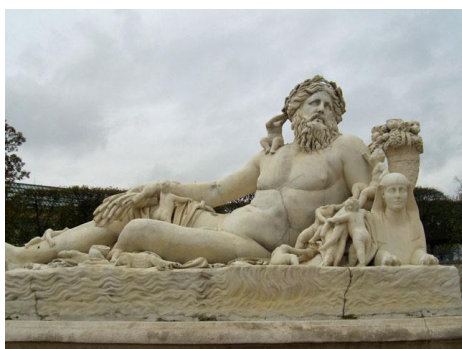
Statue dédiée au Nil

En remontant le jardin en direction du Louvre, nous découvrons de nombreuses statues réalisées au début du XIX e siècle. Après la campagne d'Égypte une véritable "égyptomanie" s'abattit sur la France, de nombreuses statues : sphinx, Cléopâtre, le Nil, etc., se trouvent aujourd'hui autour du Louvre ; Gérard en passant nous signale les statues représentant les fleuves de France. Nous avançons vers la cour carrée du Louvre modèle de noblesse et d'équilibre.