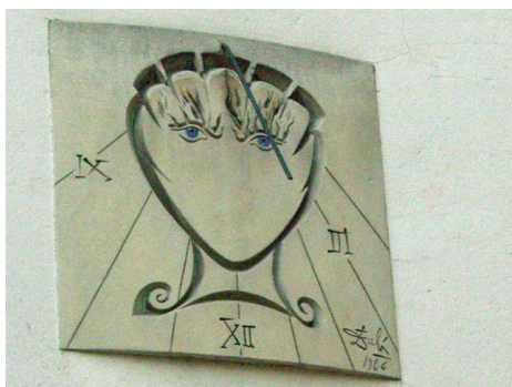
Le cadran solaire par Salvador Dali

Nous entrons dans le Conservatoire National des Arts et Métiers où se trouve également un grand cadran solaire restauré ; un peu plus loin au Mont de Piété on distingue au sol l'emplacement d'un rempart de Philippe Auguste.