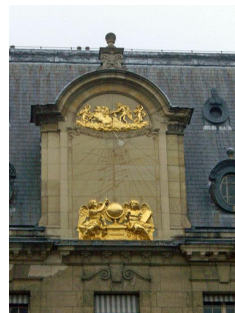
Cadran solaire de la Sorbonne