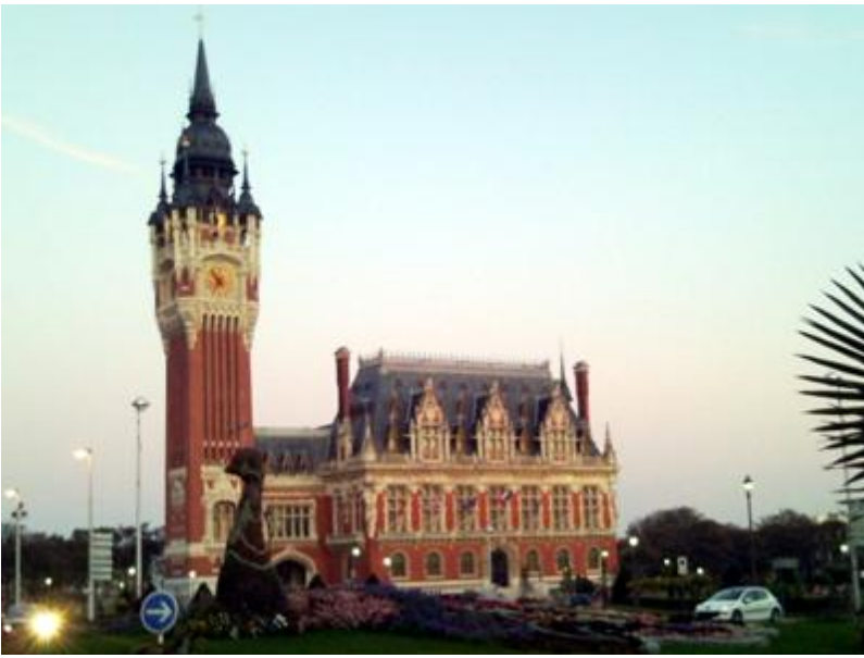
Hôtel de ville de Calais