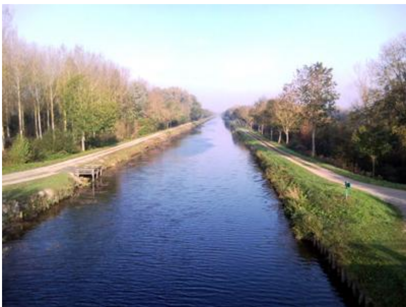
Le canal de la Somme

De retour dehors, le froid me saisit, il fait encore -2°C.