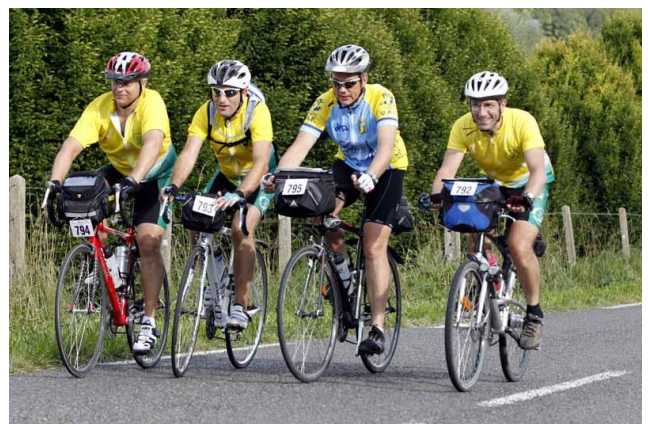
A 20 km de l'arrivée

Après la petite halte récupératrice, et les 30 derniers kms s'annonçaient tranquilles, mais c'était sans compter sur les descentes et les montées !!!