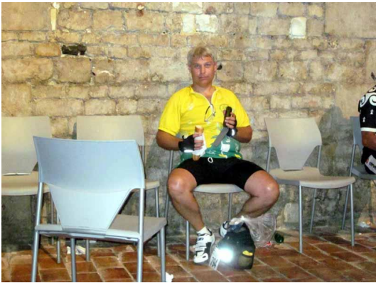
Le repos du guerrier