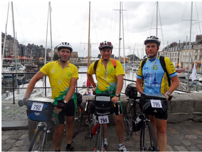
Souvenir du vieux bassin de la lieutenance

Merci chaleureusement à mes trois coéquipiers.