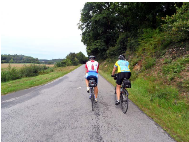
Les grandes distances font faire des rencontres

Une petite collation agréable nous attendait, sous le soleil qui nous ne quittera pas de la journée.