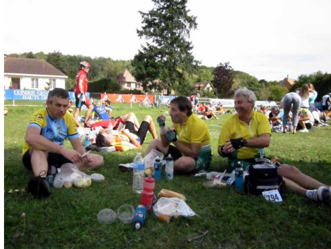
Pique-nique du midi

Après quelques km les quatre ABEILLES se rejoignent au second ravitaillement aux environs de 11h45 au km 119.