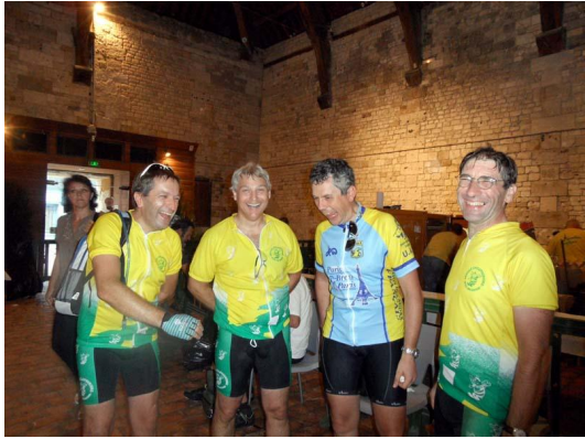
Quatre abeilles contentes d'être arrivées