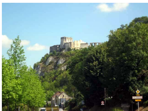
Le château des Andelys

La nuit a fait son effet et nous avons attaqué la journée sur un bon rythme. Le vent favorable s'est rapidement levé et nous avons pu prendre un en-cas costaud à Évreux vers 9h00. Un peu avant midi nous repassons à Seine à Gaillon et nous passons au pied du château des Andelys. Nouvel arrêt contrôle/ravitaillement à 14h00 à Forges les Eaux, dernier contrôle avant l'arrivée à encore 150 km.