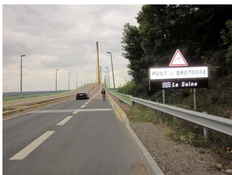
Le Pont de Brotonne