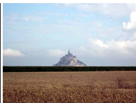
Le Mont-Saint-Michel au lever du jour