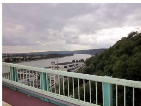
La Seine au pont de Brotonne

Après Bourg-Achart le parcours a commencé à attaquer les côtes de la Normandie. Contrôle à Beuvron en Auge. La crêperie est encore ouverte mais les fourneaux sont arrêtés, il n'est plus possible d'avoir un plat chaud. Nous discutons avec un couple qui se prépare à partir six mois en vélo couché, à destination de la Grèce. Nous passons un peu pour des fous mais finalement il nous est proposé un sandwich qui sera énorme, avec un coca et un café on doit passer une bonne nuit. L'arrêt fort sympathique se prolonge et au moment de partir la patronne refuse que nous lui payons nos consommations. Elle nous donne juste une carte pour que nous fassions un peu de publicité pour son établissement fort accueillant.