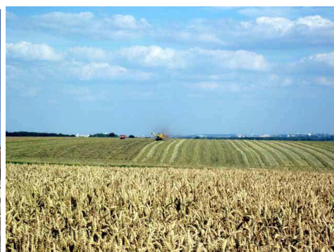
Champs dans la plaine picarde

Ça semble presque fini, mais mon équipier a de nouveau un moment de faiblesse, le voilà derrière moi dans les côtes alors qu'il est habituellement devant. Il fait très chaud alors on fera un arrêt complémentaire dans un café pour se désaltérer et se rafraîchir.