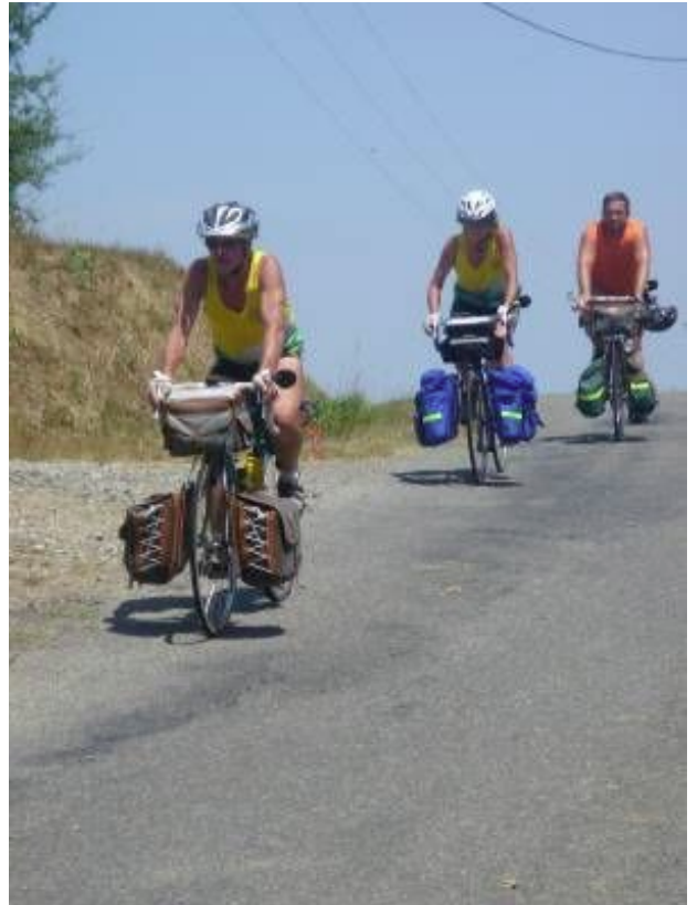
Tagada, tagada, voilà les Dalton