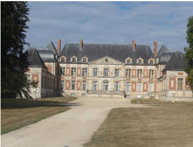
Château de COURSON