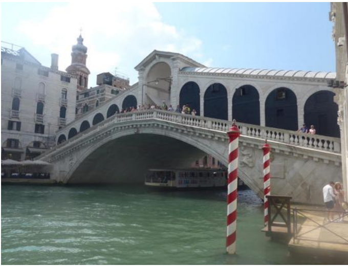
Le pont du RIALTO (Venise)