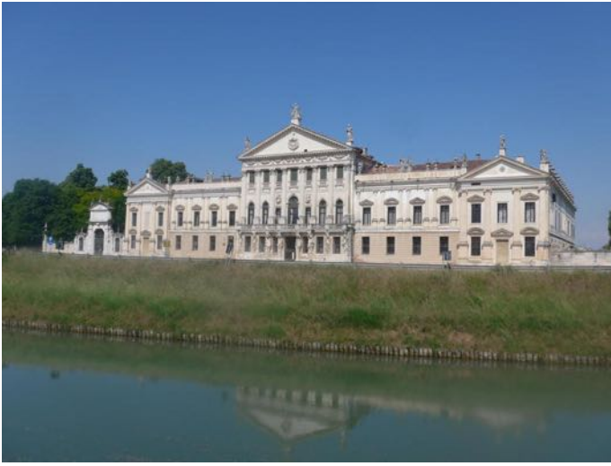
Villa Palladienne au bord du canal de BRENTA