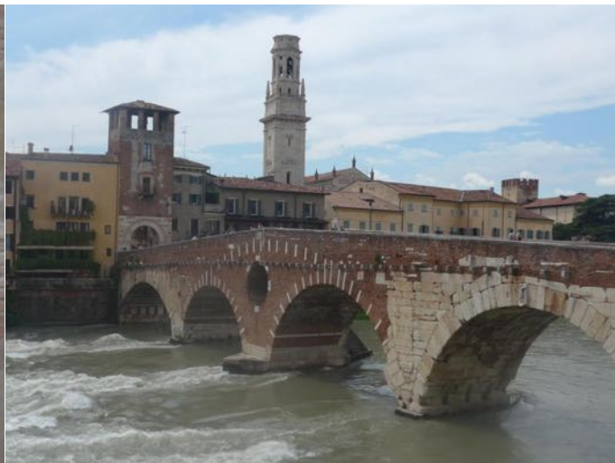
Vérone, le vieux pont sur l'Adige