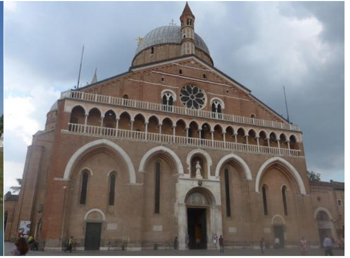
BASILIC Saint-Antoine de Padou