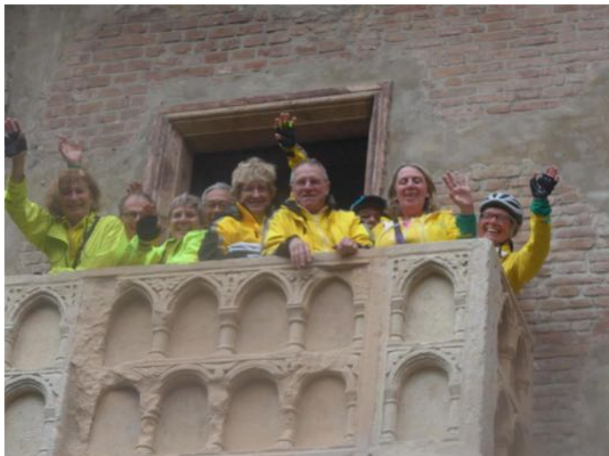
Nos féminines sur le balcon de Juliette (Vérone)

Pour ses cinquante années d'existence, la section cyclo de l'Abeille de Rueil-Malmaison à privilégié le tourisme aux dépens du vélo. Nous visiterons, Vérone, Padoue, Venise, Ravenne. A vélo, les berges du lac de Garde, longerons le canal de BRENTA, bordé de ses célèbres villas Palladiennes, du nom de l'architecte Andréa PALLADIO (1508-1580). Visite de PADOUE, le delta du Pô, et un petit tour dans les Apennins, la République de San Marin, et la très belle ville d'Urbino, berceau du peintre de la renaissance Raphael, et le célèbre champion de moto, Valentino ROSSI.