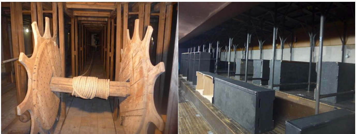
Sous la scène, les machineries, occupent 6 niveaux

Nous suivons notre guide dans les loges, réservées aux chefs et musiciens. Pour un tel établissement, elles me semblent désuètes et étriquées. Nous traversons la fosse d'orchestre, escamotable, elle peut accueillir plus de 100 musiciens. Puis visitons l'un des 6 niveaux, s'est un enchevêtrement de cordes permettant le remplacement rapide des décors. Au XIXème siècle, ce sont d'anciens marins qui se chargeaient des manœuvres. Sans emploi, après l'effondrement de la marine à voile, ils sont embauchés dans de nombreux théâtres.