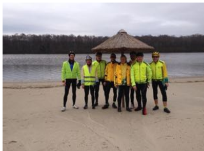
Étangs de Hollande (Boulogne)

Tout le long de l'année nous avons roulé, bravant le froid, gravissant monts et montagnes. Plusieurs d'entre nous ont participé à des rallyes et des brevets chez nos voisins de Levallois, Boulogne, Suresnes, Maisons-Laffitte.