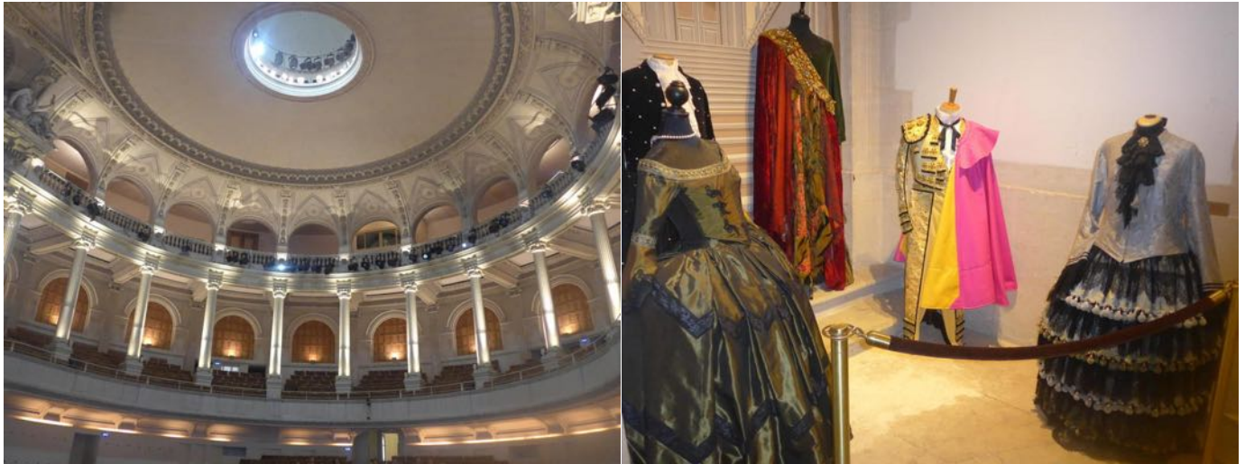
Le plafond sans décoration

Les sculptures sont terminées à temps, la décoration du plafond, qui devait comporter des peintures, reste nu. Un siècle plus tard, les travaux reprennent, et en 1991, à lieu la première représentation lyrique. Les qualités acoustiques de la salle en font l'une des meilleurs au monde. De conception dite 'à l'Italienne', la structure à 90% en bois, révèle ici, un écrin exceptionnel.