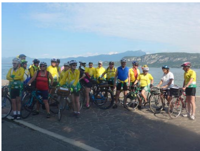
Les abeilles au bord du lac de Garde