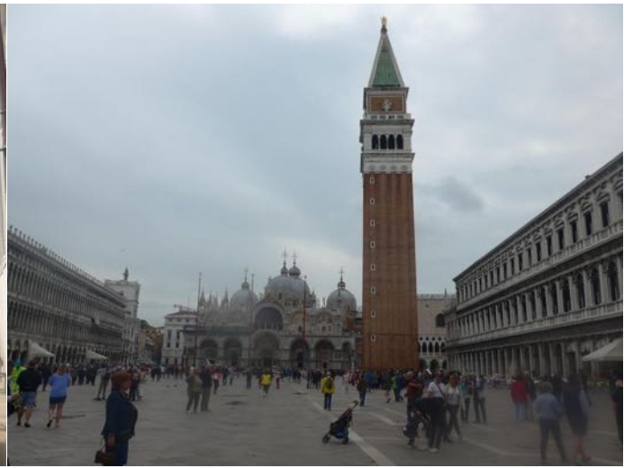
La place Saint-Marc et le palais des Doges