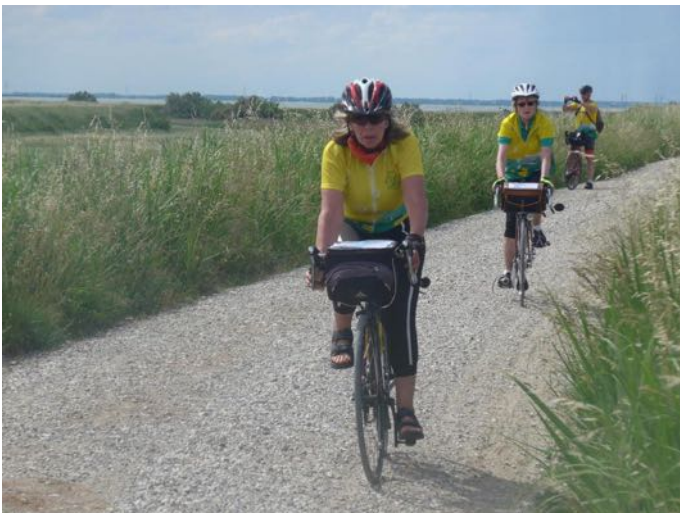
Sur les sentiers du delta du Pô