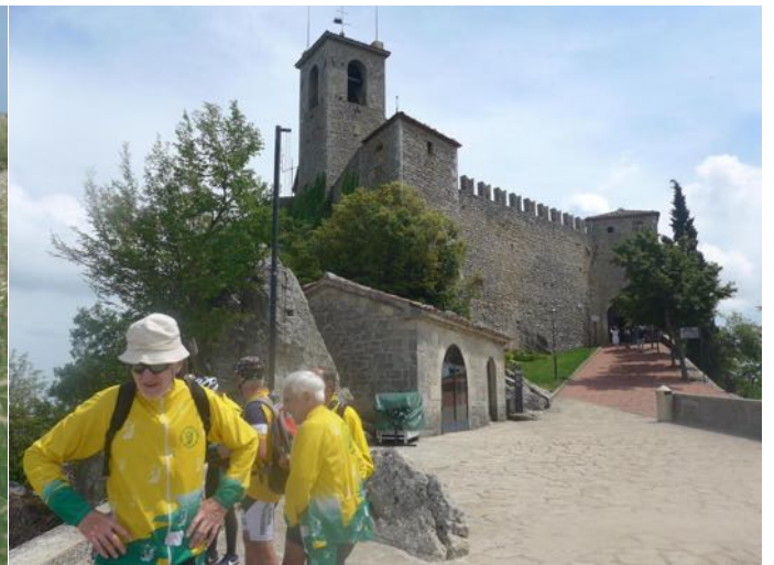
Les murailles de la République de San Marin