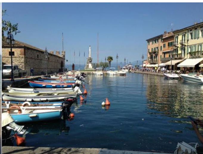
Le port de Bardolino, célèbre pour son vignoble