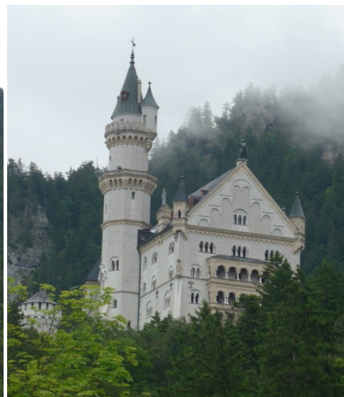
Le château de HOHENSCHWANGEAU.