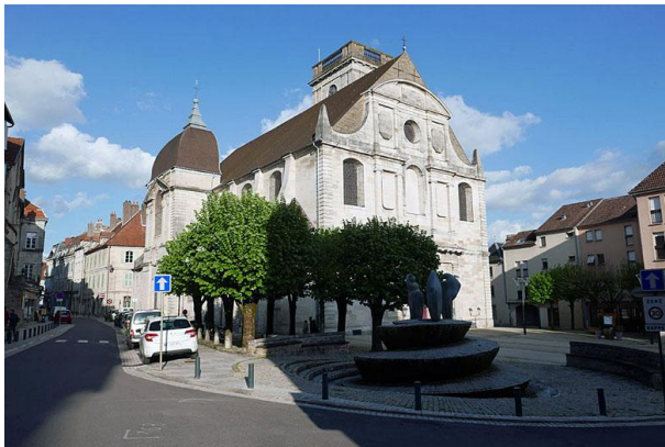
Église Saint-Georges XVIIIème siècle

Vesoul n'est pas sur l'itinéraire, mais c'est un site BPF qui mérite le détour et c'est un bon endroit pour faire étape. Nous y arriverons assez tôt pour visiter la vieille ville avec ses bâtisses en pierre.