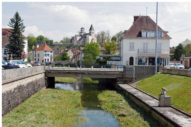
La Seine à Chatillon-sur-Seine

À Vanvey on remarque un lavoir de grande dimension, ouvert sur la rivière, l'Ource. À l'entrée de Recy-sur-Ource le lavoir est clos et l'eau ne se voit qu'à l'intérieur.