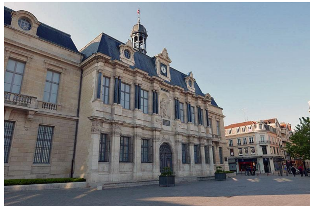
Troyes, maisons à colombage et Mairie

Deuxième étape , Troyes-Auberive 130 km : soleil et vent favorable, comme hier. Il fait plus chaud dès le matin et la température doit monter à 18° dans l'après-midi.