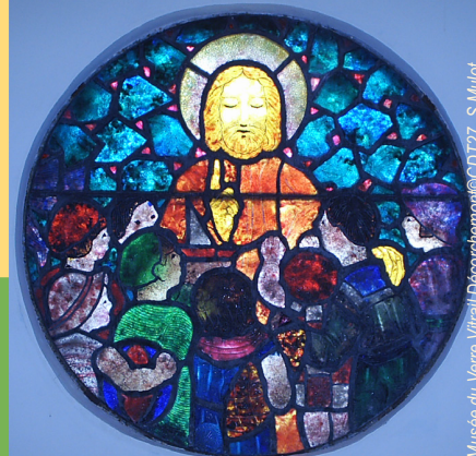
Musée du Verre Vitrail Décorchemont

Les célèbres verrières du chœur de l'église S te -Foy constituent un exemple unique en France de l'art verrier du XVI e siècle et témoignent de la richesse de cet art dans l'Eure, qui compte plus de 6 000 m 2 de verrières antérieures à la Révolution. Conches est aussi la patrie du maître-verrier François Décorchemont (1880-1971), artiste novateur reconnu pour sa technique unique appliquée à l'art du vitrail. Un Musée du Verre et de la Pierre lui est en partie consacré.