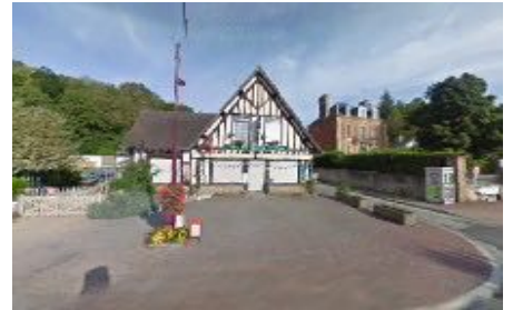
le relai d Ajou 1 route de la barre 27410 Ajou tel 02 32 30 70 78

Dimanche 26 Février (parcours environ 70 km)